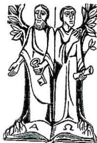
hll. Petrus u. Paulus